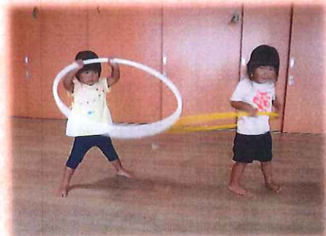
クルクルまわせるかな？