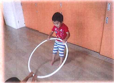
よいしょっ！ よいしょっ！