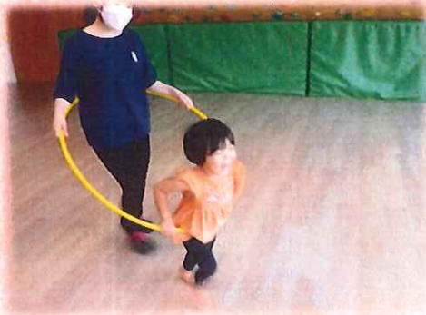
しゅっぽ！しゅっぽ！