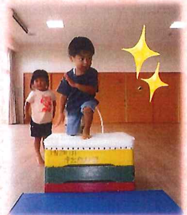
ヒーローになりきって！ いくぜっ☆