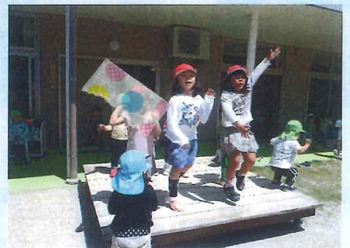
ダンスしてまってよ~