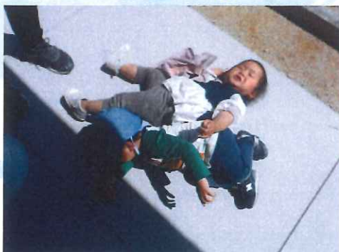
「はやくたべたい!」 「ねえ! まだなの!?!」 待ち遠しいお友達も...