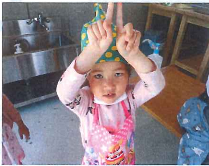
エフロン着て気合が入ります!

今日はパンまきクッキング♪こねこねしたり、あんこを入れたいしてつくりました(*'▽') おいしくできて嬉しそうな子ども達でした!