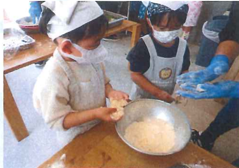
丸めるの難しいなあ...