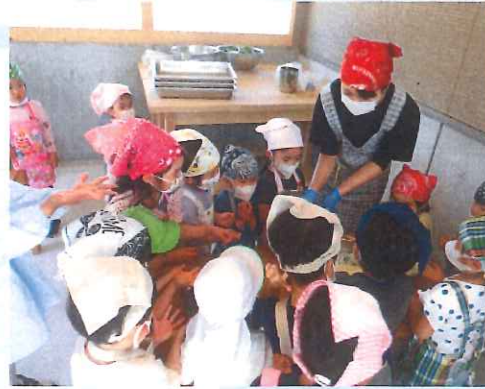
「わたしもやいたーい」 早くやいたくてウスウスです(笑)

今日はパンまきクッキング♪こねこねしたり、あんこを入れたいしてつくりました(*'▽') おいしくできて嬉しそうな子ども達でした!