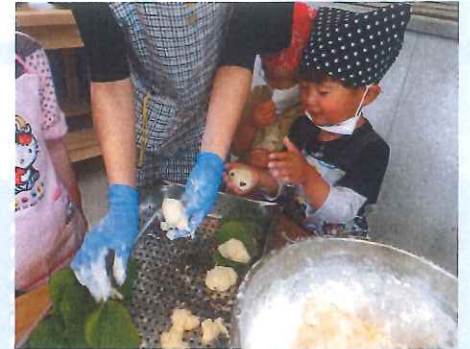
あんこを入れたら葉っぱを巻くよ!